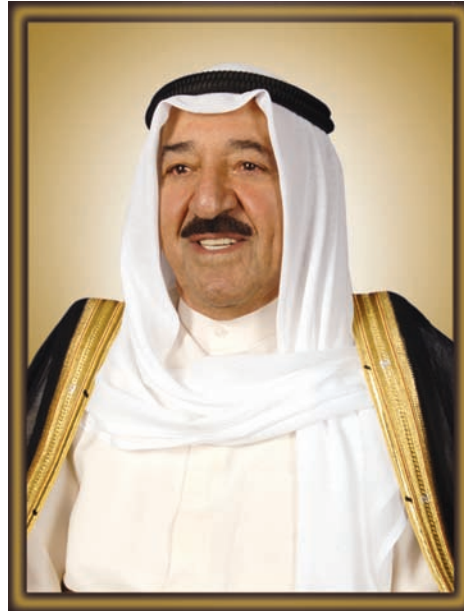
صَبَّاحُ بْنُ أَحْمَدَ بْنِ عَبْدِ الرَّحْمَنِ السَّبَّاحِ أَمِيرَ دَوْلَةِ الْكُوَيْتِ