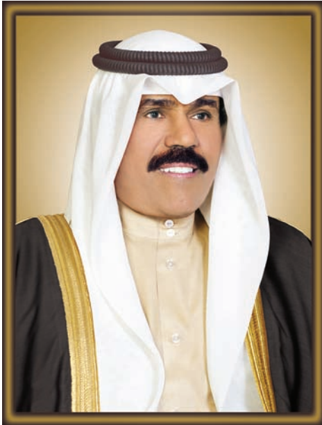
سَمَو الشَّيْخِ نَوَافِ بْنِ فَهْدِ بْنِ عَبْدِ الرَّحْمَنِ السَّبَّاحِ وَلِيَّ عَهْدِ دَوْلَةِ الْكُوَيْتِ